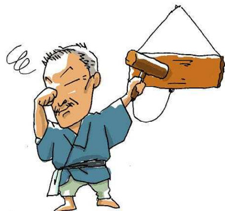
イラスト:高橋一子(秋田県鹿角地域振興局農林部農業振興普及課)